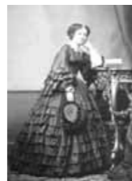
Фрейлина Анна Тютчева о Николае I

«Он чистосердечно и искренне верил, что в состоянии всё видеть своими глазами, всё слышать своими ушами, всё регламентировать по своему разумению, всё преобразовывать своею волею. В результате он лишь нагромоздил вокруг своей бесконтрольной власти груды колоссальных злоупотреблений, тем более пагубных, что извне они прикрывались официальной законностью и что ни общественное мнение, ни частная инициатива не имели ни права на них указывать, ни возможности с ними оротиться»