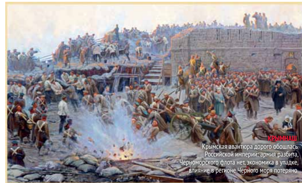
КРЫМНАШ Крымская авантюра дорого обошлась Российской империи: армия разбита, Черноморского флота нет, экономика в упадке, влияние в регионе Чёрного моря потеряно

«Мы были убеждены, что только несчастная война могла остановить дальнейшее гниение»