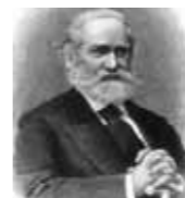
Сергей Соловьёв, российский историк

«Мы были убеждены, что только несчастная война могла остановить дальнейшее гниение»